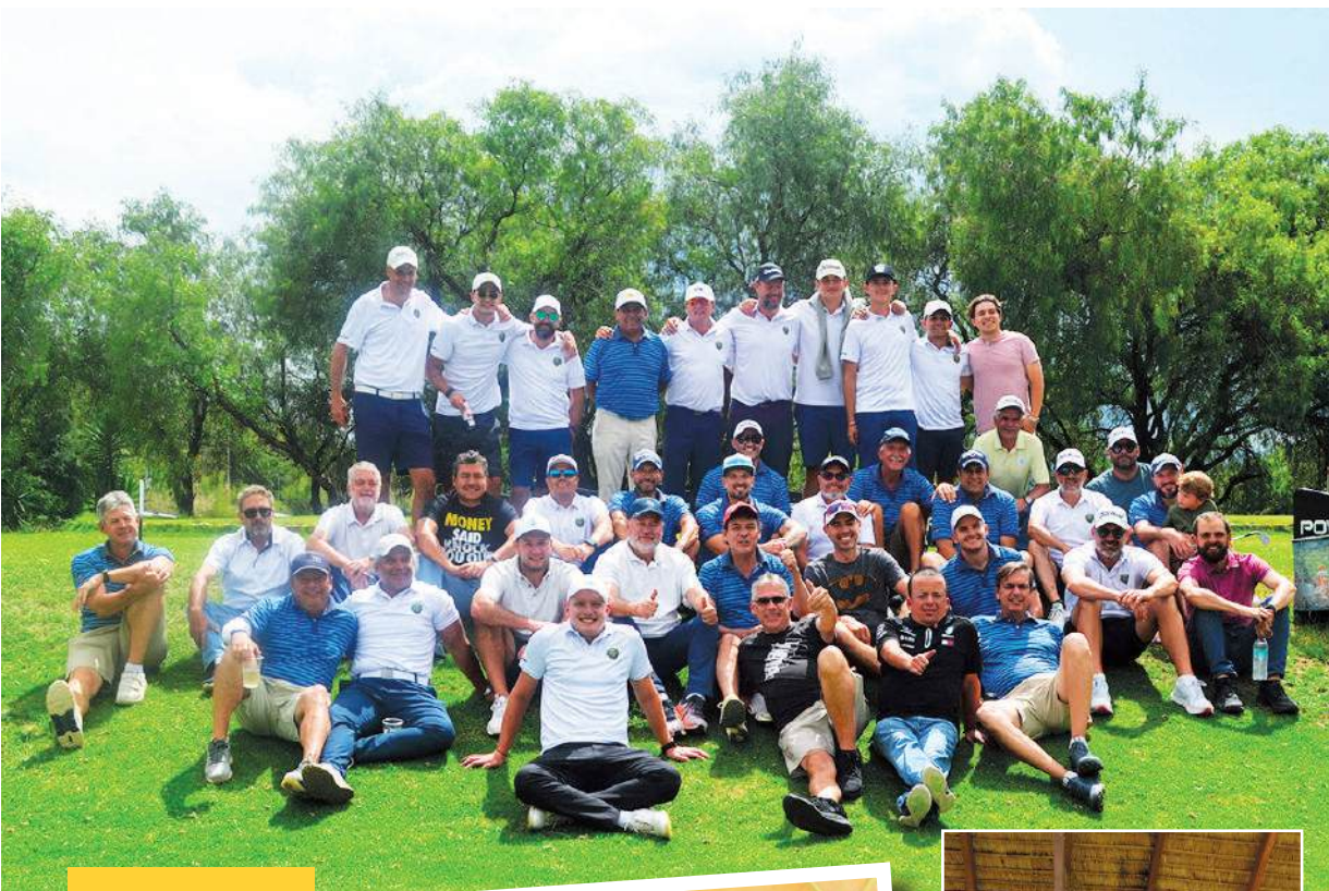
Los equipos de La Paz y Cochabamba, en los links del Country Club