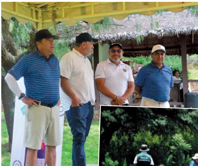
Equipo de Cochabamba con el trofeo de ganadores del Ryder Cup