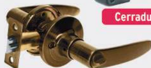
Manijas, cilindro de latón