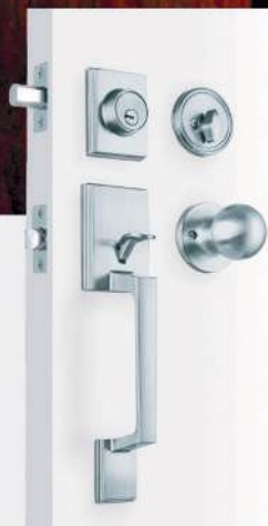
Jaladera y perilla Minimalista