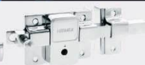
Cerradura de barra fija