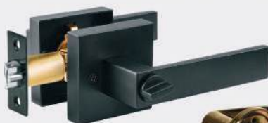
Cerraduras de Manijas Minimalista