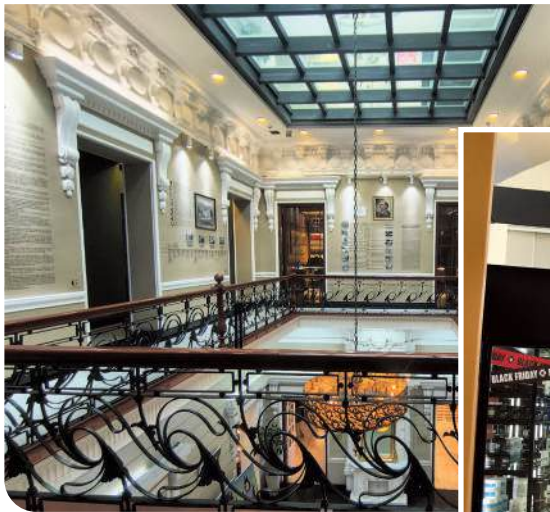
Casa Goytia, patrimonio restaurado, valor cultural y posicionamiento.