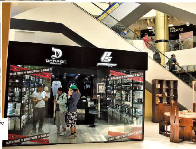
Más de 50 marcas bolivianas y extranjeras están instaladas en los tres niveles del Mall.