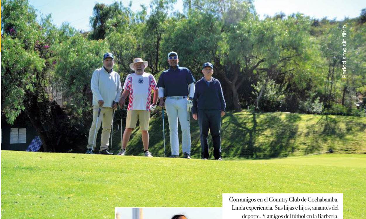
Con amigos en el Country Club de Cochabamba. Linda experiencia. Sus hijas e hijos, amantes del deporte. Y amigos del fútbol en la Barbería.