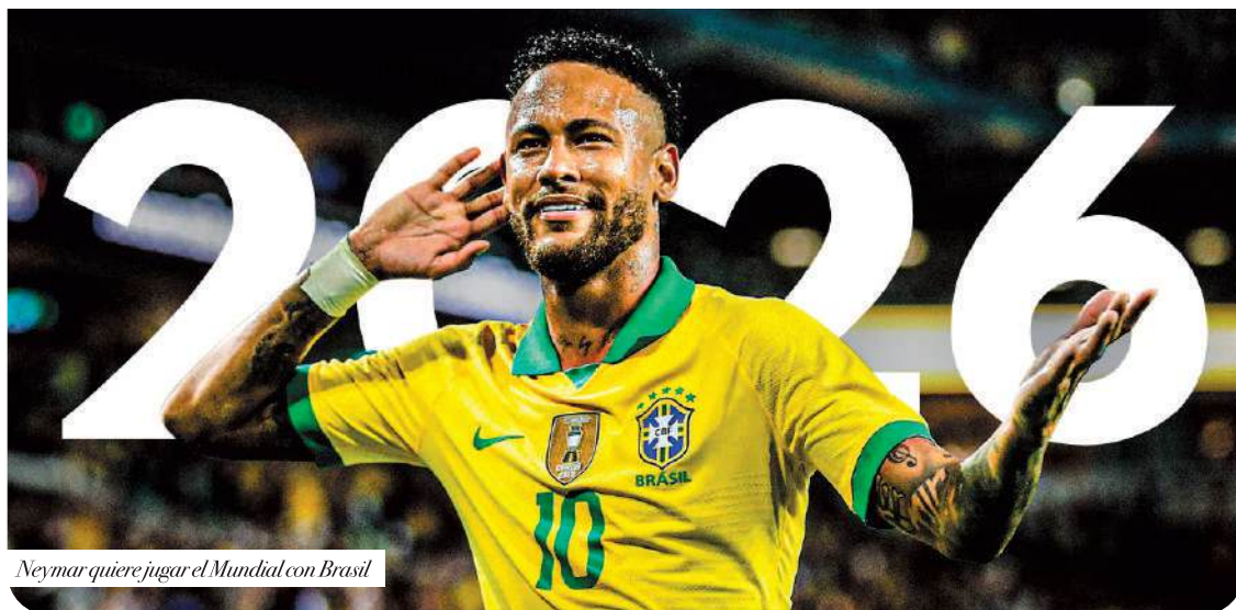
Neymar quiere jugar el Mundial con Brasil

Raphinha asumió un rol protagonista en Barcelona y llegó a perfilarse como fuerte contendiente al Balón de Oro, aunque el premio de 2025 terminó en manos de Ousmane Dembélé.