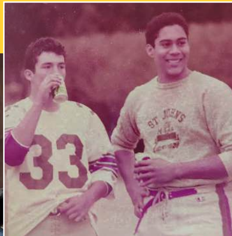
Jugando golf en Cochabamba, en funciones diplomáticas y de joven jugando al soccer.

“ Soy un apasionado de los deportes y lo practico desde muy chico alentado por mi padre, así que en Bolivia, no dejo mi afición y sigo jugando”.