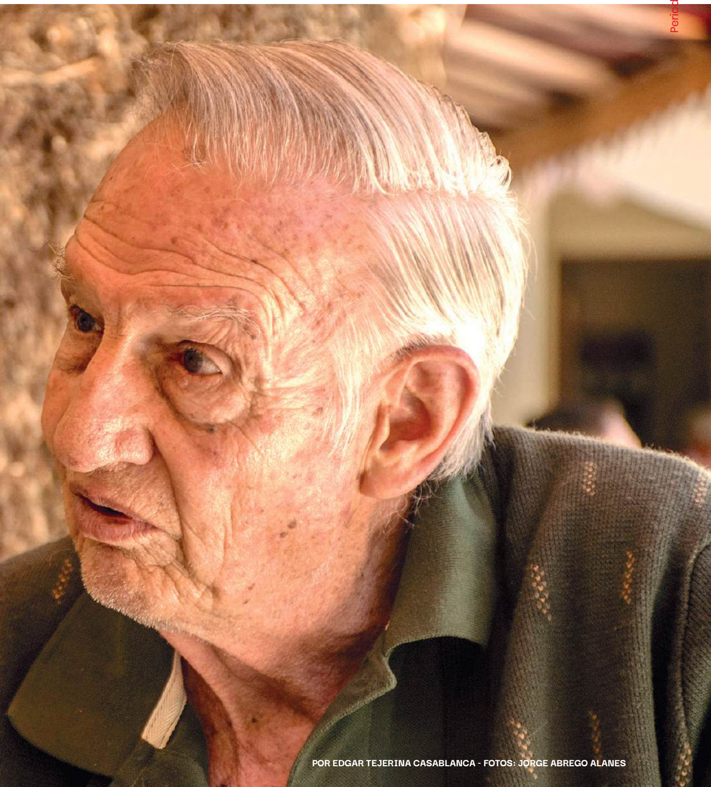
POR EDGAR TEJERINA CASABLANCA